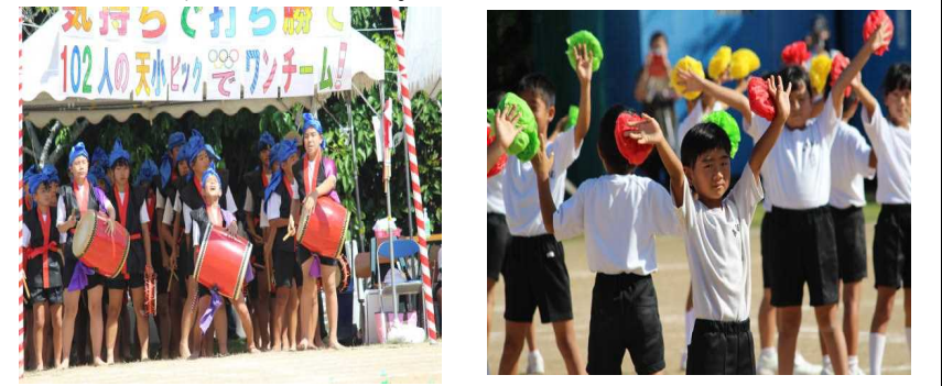
【上学年「天小エイサー隊」】 【下学年「天小から愛を込めて」】

このように、運動会を無事に終わることができたのは、保護者、地域の方々のお陰です。新型コロナウイルス感染予防のための受付・検温や、立派な緑門作りなど御協力に感謝申し上げます。最後まで全力でがんばった子どもたちをぜひ褒めてください。本当にありがとうございました。