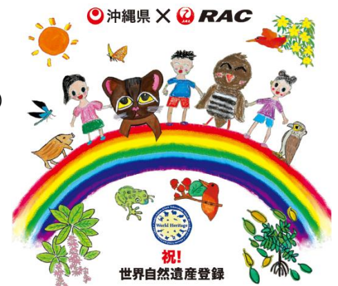
RAC特別塗装機デザイン(イメージ)

機材：デハビランドDHC-8-400カーゴコンビ型機(機番:JA85RC) (座席数:50席)