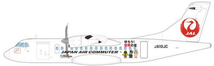
JAC特別塗装機(イメージ)

また、日本トランスオーシャン航空(JTA)と琉球エアークommuter(RAC)は、2021年3月から、沖縄県主催の図画コンクールにて小中学生が地域の希少動植物を描いた入賞作品を機体にデザインした特別塗装機が就航していますが、世界自然遺産の登録に伴い、機体の文言を「目指せ!」から「祝!」へ変更して運航します。