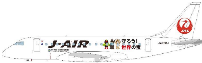
J-AIR特別塗装機(イメージ)