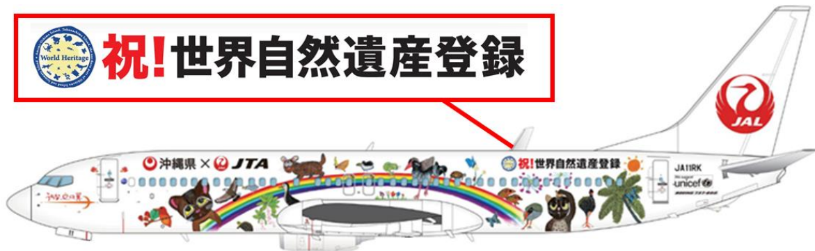
JTA特別塗装機(イメージ)