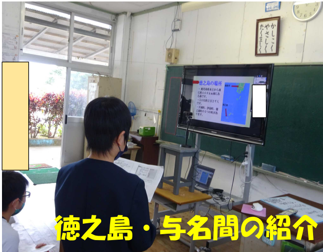
徳之島・与名間の紹介

2月9日(木)、コロナ禍の中、霧島市立高千穂小学校3年生と与名間分校3・4年生のオンライン交流会を行いました。高千穂小学校は、与名間分校の前任のK教頭先生が現在勤務されている学校です。同じ鹿児島県ですが、霧島連山に位置し、標高が高く寒い(雪も降る)高千穂小学校と温暖なここ徳之島与名間分校。高千穂小には、「わらべ湯」という温泉が学校の仲にあると聞いてビックリ!!先週の土曜日には、雪も3cmほど積もるくらい降ったとか・・・高千穂小の子どもたちも徳之島の自然や生活についていろいろな質問をしていました。コロナ禍の中、このような環境がありオンラインを通してお互いの地域や学校の様子を知ることができました。