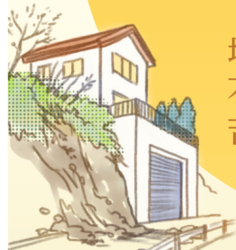
がけ崩れによる 道路の封鎖