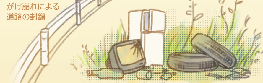
所有地へのゴミ投棄