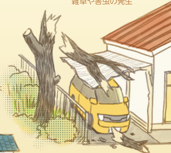
台風や積雪による倒木