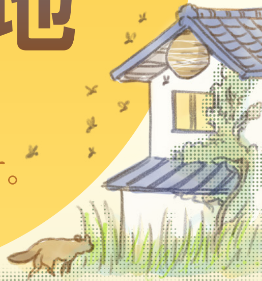
雑草や害虫の発生