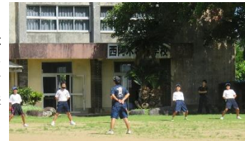
中学生『応援団練習』

あっという間に42日間という長い夏休みも過ぎ、いよいよ2学期がスタートしました。今回の夏休みも、新型コロナウイルス感染症予防を常に考えて行動しなければならず、思い通りにならない面もあったと思いますが、そんな中でも、たくさんの思い出ができた休みとなったようです。