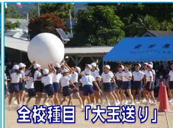
全校種目「大玉送り」