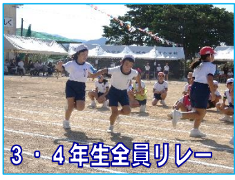
3・4年生全員リレー