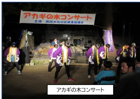
アカギの木コンサート