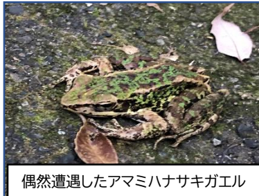
偶然遭遇したアマミハナサキガエル