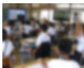
スマホネット安全教室