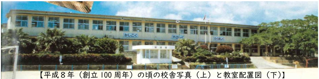
【平成8年（創立100周年）の頃の校舎写真（上）と教室配置図（下）】

明治29年7月1日に岡前尋常小学校として創立された本校は、今年創立130年という節目の年となります。