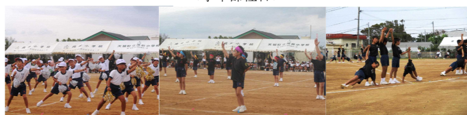
「1・2年ダンスヒーロー」 「3・4年剛!手舞いの空」 「5・6年集団演技」