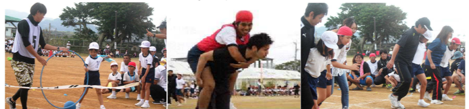
「1年親子で1・2」 「6年親子仲よしリレー」