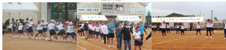
「綱引き」 「ワイド節・花の島 徳之島」 「エール交換」