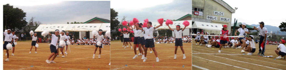
「応援合戦」 「紅白対抗リレー」