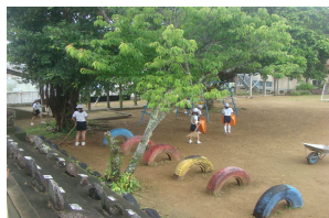
【朝のボランティア活動】

特に「確かな学力の定着」は、とても大切です。学校では、質の高い授業目指して、「一人一研究授業」や「天城町授業づくりの「目」」の実践にさらに力を入れていきます。もちろん、小規模校ならではの個別指導やきめ細かな指導も工夫が必要です。御家庭では、引き続き「家庭学習の時間の確保」、「基本的な生活習慣の確立」に向けての実践をお願いします。子供たちにとって「睡眠時間」はとても大切です。