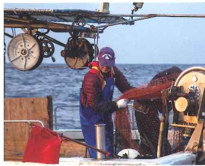
ごち網漁／江口漁港