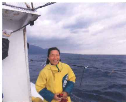
トビウオロープ曳／屋久島