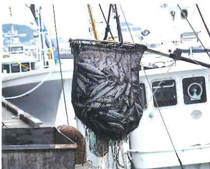
枕崎漁港の水揚げ風景