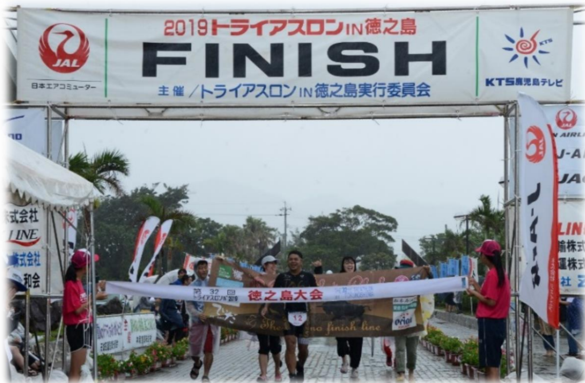
イメージ写真：第32回トライアスロンIN徳之島大会