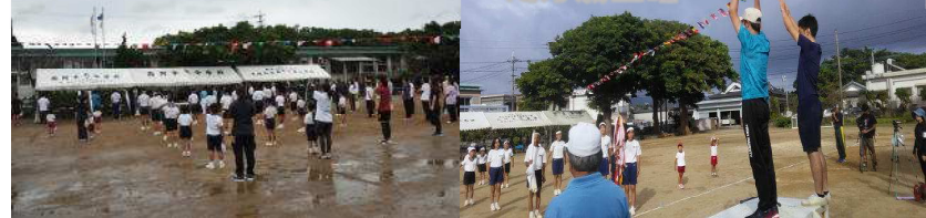
西阿木名幼小中、三京、分校PTA会長2人で行った万歳三唱