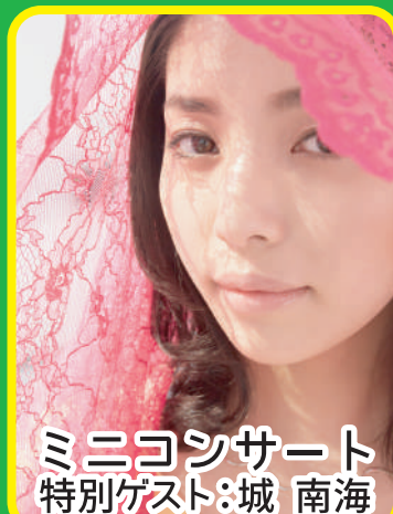
ミニコンサート 特別ゲスト：城 南海