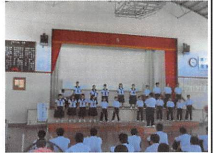
校内合唱コンクール

一学期が終了しました。全部で65日でした。この一学期は、出鼻をくじかれて、そこからあとは、何やら怒涛の展開でした。生活リズムしかり、学習の進ちよく状況しかり、どれだけ自分自身にムチを打って頑張ることができたでしょうか。おそらく自分の目標に向けて、精一杯取り組めた人は、たぶん後悔なく、やるだけやったぞ！と心爽やかな、清々しい（すがすがしい）気分であることと思います。 各種スポーツも活気を取り戻してきていますが、徳之島中体連もなくなった全国・九州・県・地区中体連大会の代替大会として「メモリアルマッチ」が開催されます。すでにバスケットボールは、先月下旬に亀津中でやっていました。私の好きなスポーツにバスケットボールがありますが、その中でも特に「ブザービート」というプレーのタイミングに出くわしたとき、心が躍ります。 ブザービートとは、試合終了のブザーが鳴った瞬間に放たれたボールがすっと相手のゴールの網に吸い込まれていくプレーです。テレビなどで目にしたことがあるのではないのでしょうか。