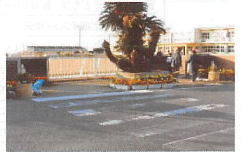
P T A 保体環境部作成の門松

令和3年のスタートですね。今年の正月は、新型コロナの影響で帰省もできにくい状況でしたが、いかがでしたか。初詣もなかなかできにくい状況で、いろいろと気をもむことが多かったのではないのでしょうか。闘牛大会が元日から無事開催できていましたが、幼保小中学生と学校の教員の参加は禁止要請が来ていました。参加できず、残念に思っていた人も多かったのではないのでしょうか。残念続きの年始ではありますが、みんなのそうした協力が大きな花を咲かせると思ってもうしばらく頑張りましょう。 私は、生徒一人一人の今年の活躍を思い、三年生の全員合格を初日に拝みました。生徒の皆さん・保護者の皆様、地域の皆様、今年も天城中学校の教職員一同、精一杯教育活動に頑張るまいりますので、御支援・御協力をどうぞよろしくお願ひいたします。