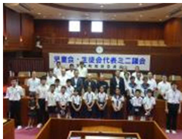
<ミニ議会集合写真>