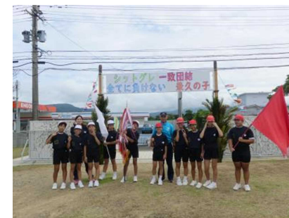
6年・校長先生最後の運動会