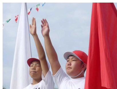
開会式・選手宣誓

当日は、少し雲の多い日でしたが天気にも恵まれました。そして、今年も校庭の真ん中には、子どもたちを見守る竹とこいのぼり。PTAの保体環境部のお父さんたちを中心に竹取りに行き、立ててくださいました。今年はずっとより子どもたちの活躍の場も少ない中でしたが、子どもたちは一つ一つの種目に気合いが入り、本当に子どもたちの一生懸命さの輝く運動会になりました。元気いっぱい、笑顔いっぱいの子どもの活躍を紹介します。